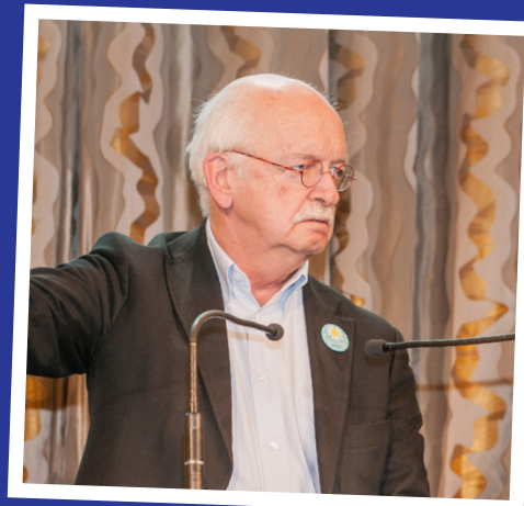
Erik Orsenna à la remise du Prix 2019